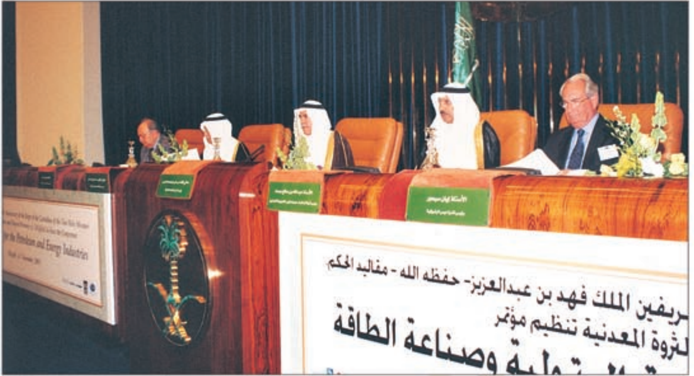
الجلسة الافتتاحية لمؤتمر الخدمات المساندة للصناعة البترولية وصناعة الطاقة الذي عقد في الرياض بمناسبة مرور عشرين عاماً على تولي خادم الحرمين الشريفين مقاليد الحكم

يكون للزيت السعودي منظومة نقل بحري تزيد من موثوقية امداداته وتحميه من تقلبات أسواق النقل البحري، كانت استجابة أرامكو السعودية سريعة ومؤثرة من خلال توفير اسطول من الناقلات العملاقة تبلغ حمولته ما يزيد على اربعين مليون برميل.