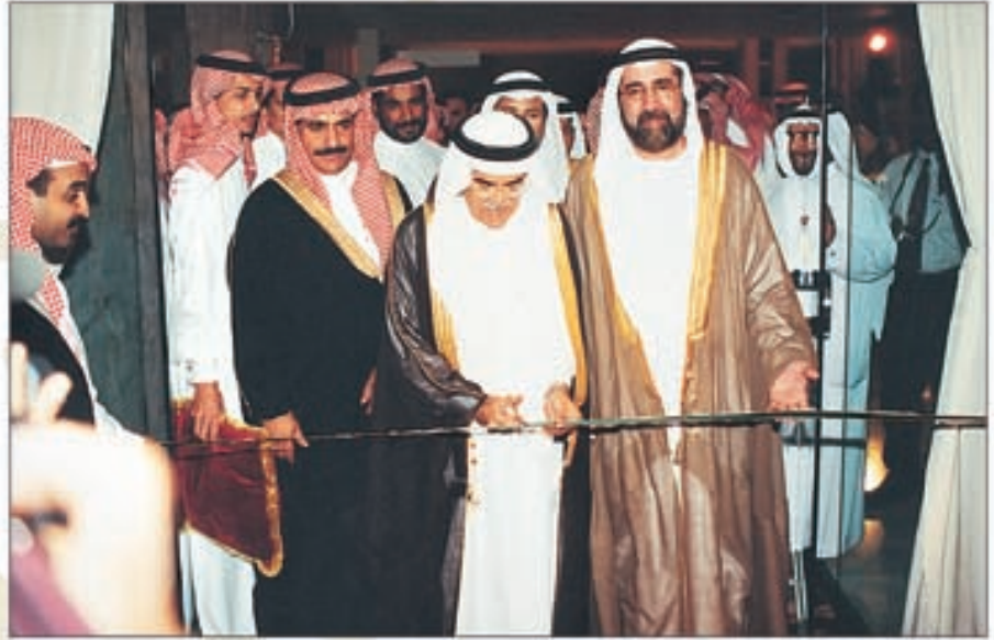
معالي الأستاذ علي النعيمي يقص الشريط إيداناً بافتتاح المعرض الذي أقيم على هامش المؤتمر

عديدة من اعمال البترول كان ابرزها التفوق في محاكاة المكامن.