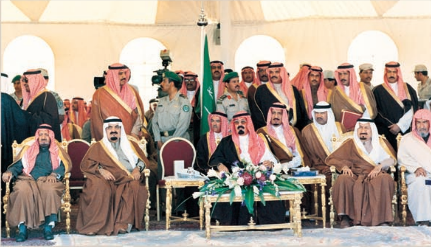
صاحب السمو الملكي الأمير عبدالله بن عبدالعزيز أثناء تشريفه حفل الافتتاح الرسمي لمرافق إنتاج الزيت في منطقة الرياض في ١١ رجب ١٤١٨هـ، بحضور عدد من أصحاب السمو الملكي الأمراء وكبار المسؤولين في الشركة