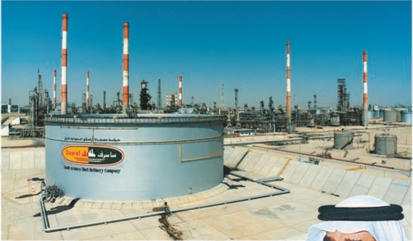
مصفاة (سأسرف) في الجبيل، التي أصبحت الشركة مسؤولة عن حصة الحكومة فيها، بعد دمج مصافي ومرافق توزيع المنتجات البترولية في المملكة