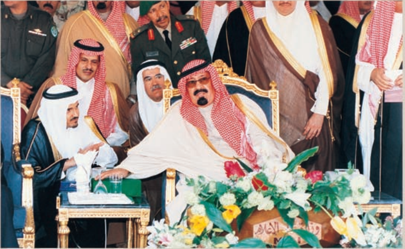
سمو ولي العهد يضغط على الزر الموصل مع غرفة التحكم بمعمل فرز الغاز من الزيت إيداناً بافتتاح حفل الشببة

وبهذه المناسبة، سجّل سمو ولي العهد كلمة في سجّل الزيارات بموقع الخزن الاستراتيجي الأول في الرياض، هذا نصها: «بسم الله الرحمن الرحيم... اليوم ونحن نفتتح برنامج الخزن الاستراتيجي لا يسعنا إلا أن ندعو الله عزّ وجلّ أن يجعل فيه منفعة لوطننا وأبناء هذا الشعب الكريم في ظل عقيدة هي المنطلق الأساس لكل مقومات حياتنا وأمتنا واستقرارنا. والله نسأل أن يوفقنا دائماً لما فيه خير شعبنا وأمتنا بقيادة أخي خادم الحرمين الشريفين، الملك فهد بن عبدالعزيز، حفظه الله، وبالله التوفيق».