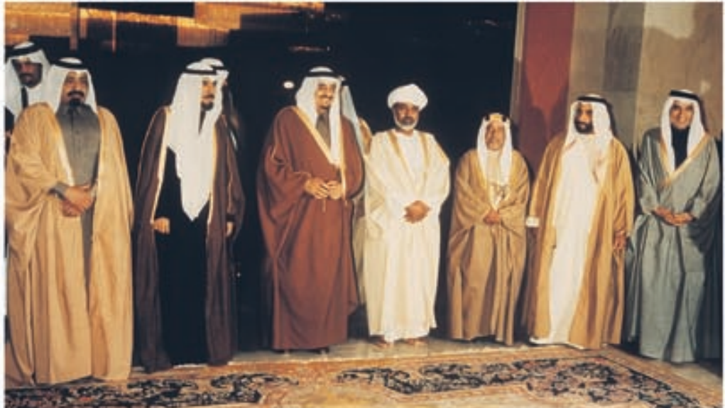
الملك فهد في أحد لقاءاته العديدة مع قادة دول