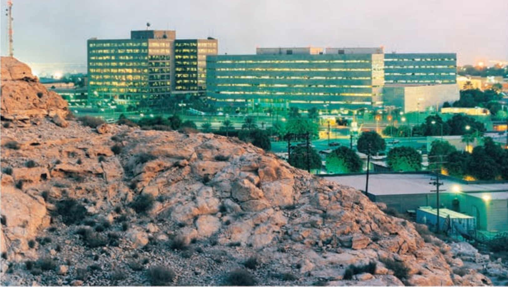
مقر إدارة أرامكو السعودية في الظهران

مجمع التدريب الصناعي في شمال الظهران، حيث تشرف أرامكو السعودية من خلاله ومن خلال مراكز مماثلة في أنحاء المملكة، على أفضل برامج تدريب من نوعها في العالم