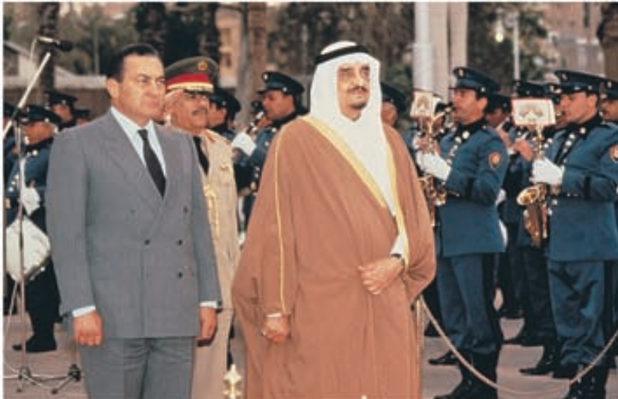
خادم الحرمين الشريفين وفخامة الرئيس محمد حسني مبارك