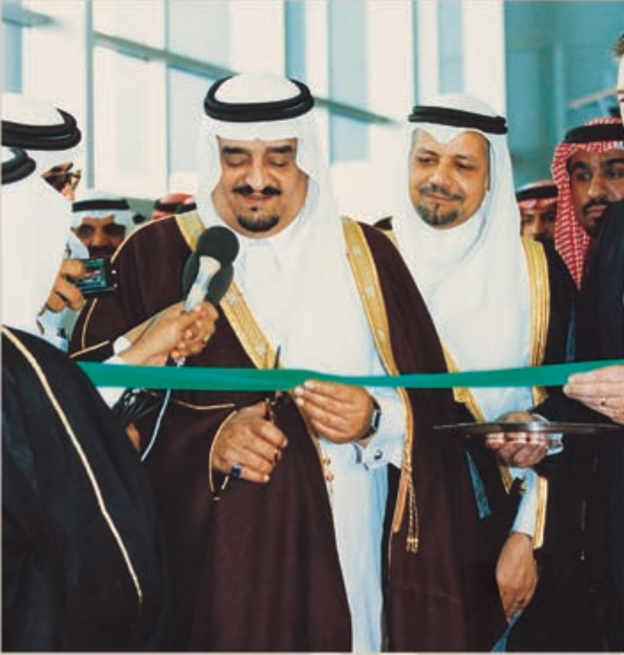
خادم الحرمين الشريفين، الملك فهد بن عبدالعزيز، يقص شريط افتتاح مركز أرامكو للتنقيب وهندسة البترول في الظهران عام ١٩٨٣م

عزز مشروع تحديث وتوسعة مصفاة رأس تنورة من قدراتها على إنتاج مكبرات عالية القيمة