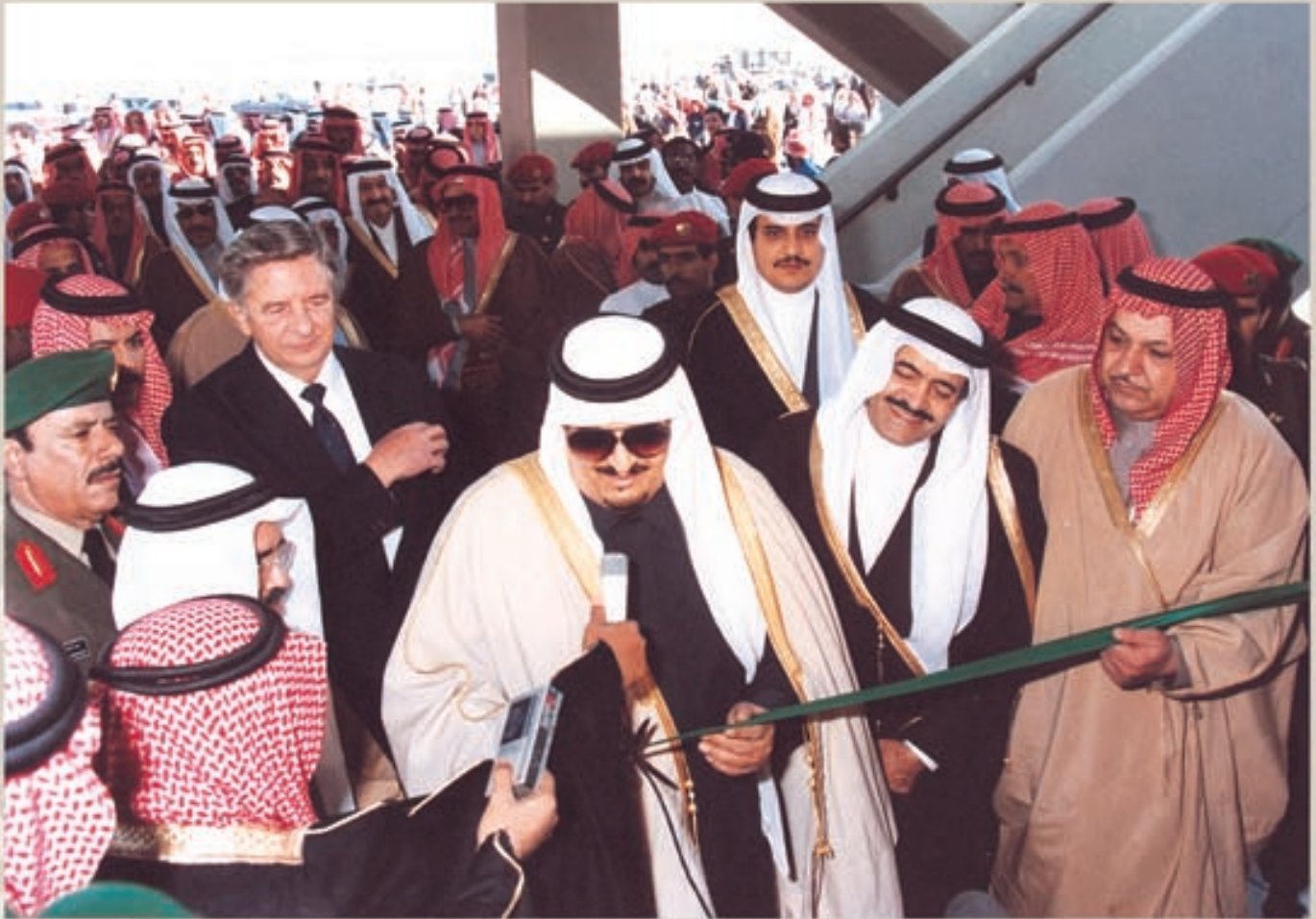
خادم الحرمين الشريفين، الملك فهد ابن عبدالعزيز، يقص الشريط إيداناً بافتتاح مركز التدريب في رأس تنورة، في ٢٢ ربيع الآخر ١٤٠٧هـ