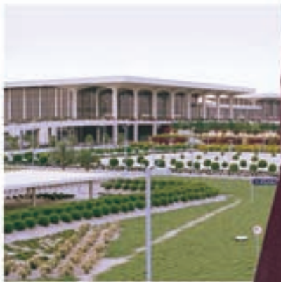
الطفرة التنموية الشاملة التي حققتها المملكة في عهد خادم الحرمين

صورة نادرة لخادم الحرمين الشريفين، الملك فهد ابن عبدالعزيز، وهو يلقي القسم بين يدي جلالة الملك عبدالعزيز، يرحمه الله، عام ١٩٥٣م في الظهران بعد أن تم تعيينه وزيراً للمعارف