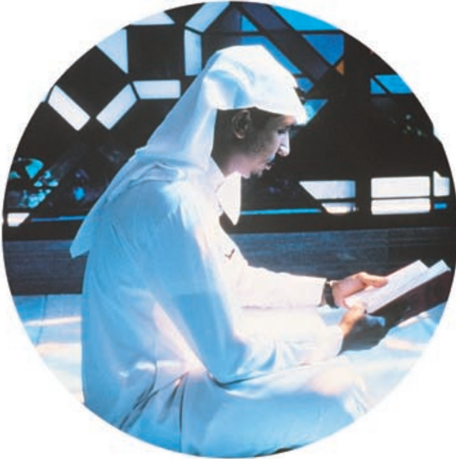
تحتاج النفس البشرية إلى التهذيب والمراقبة كما يحتاج العقل للتثقيف وتنمية المدارك

في شريعة الإسلام وسيلة توازن فذة بيد المسلم يحقق من خلالها أسمى نتائج الكمال النفسي، ويجني أجمل الثمرات بوسطية فريدة لا تحرم الجسم من شهواته ورغباته إلا لماماً، ولا تجعل الروح تعيش في غربة كئيبة لحرمانها من الاتصال بعالمها العلوي ونسبها السماوي.