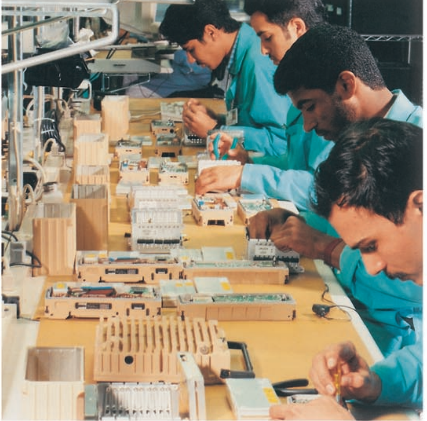
تدريب وتأهيل الكفاءات السعودية الشابة، ركنٌ مهم من أركان خطط التنمية الاقتصادية في البلاد في عهد الفهد الميمون

من قلاع التعليم العالي التي أخذت تنتشر في ربوع البلاد، في عهد خادم الحرمين الشريفين، تأتي جامعة الملك فهد للبترول والمعادن في الظهران