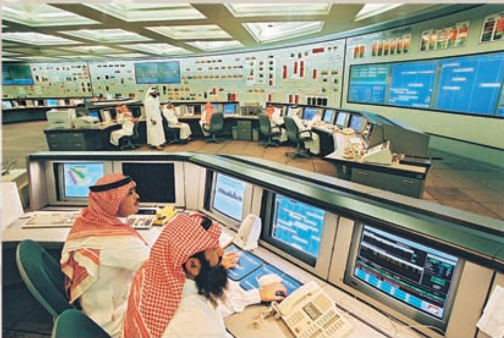
عكفت أرامكو السعودية على توفير أحدث الوسائل التقنية لإدارة أعمال الشركة