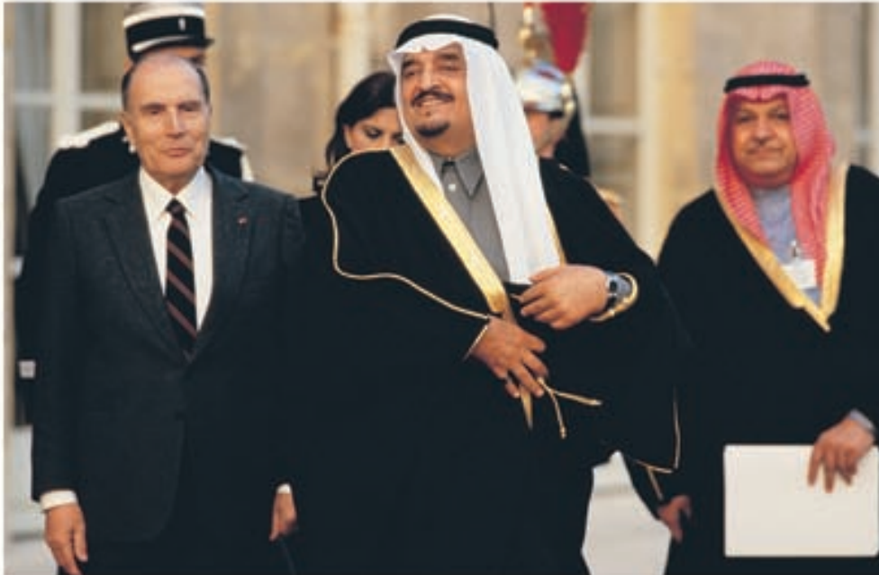
الرئيس الفرنسي الراحل، فرانسوا ميتران مستقبلاً خادم الحرمين الشريفين، في إحدى زيارته للعاصمة الفرنسية

إذا كانت مشروعات التنمية قد ازدادت في عهد الفهد ازدياداً ملحوظاً، فإن أهم مشروع يهتم المسلمين جميعاً هو توسعة المسجد الحرام والمسجد النبوي؛ حيث يجتمع مئات الآلاف من المسلمين للحج والعمرة، فيجدون كل التسهيلات اللازمة أثناء تأدية الفريضة، ويجد الحاج والمعتمر راحتها الكاملة، وهما يطوفان ويسعيان بين الصفا والمروة.