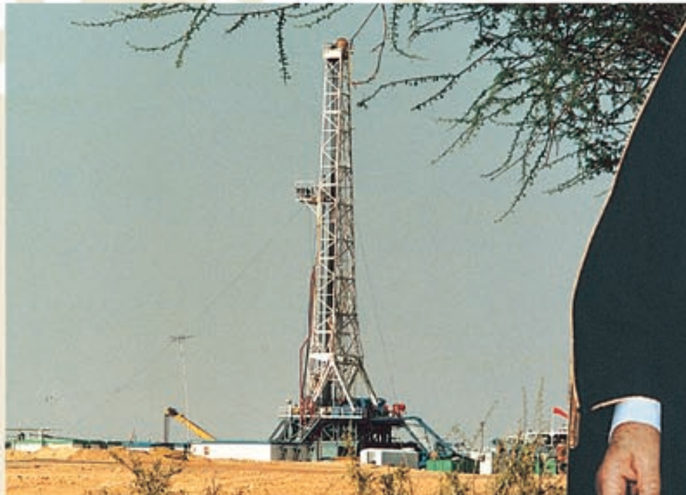
حقل الحوطة الذي أعلن عن اكتشافه عام ١٤٠٩هـ