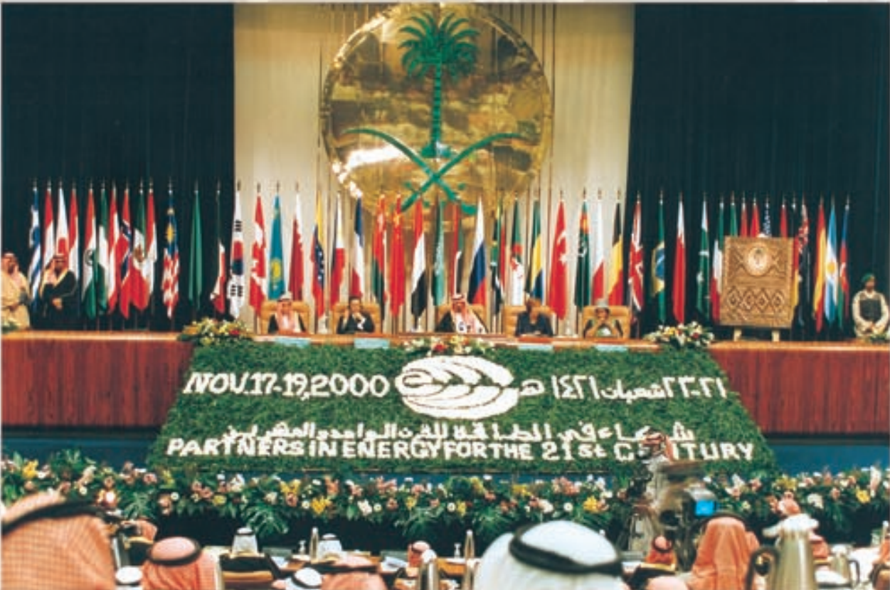
صاحب السمو الملكي الأمير عبدالله بن عبدالعزيز، مع كبار ضيوف منتدى الطاقة الدولي السادس، الذي عقد في الرياض خلال الفترة من ٢١-٢٢ شعبان ١٤٢١هـ