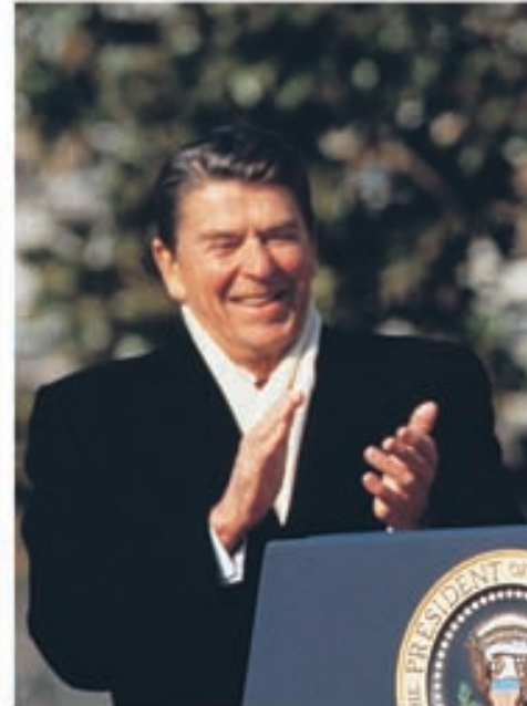
في الصورة الرئيس الأمريكي الأسبق، رونالد ريجان